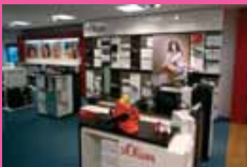
Shops von ESPRIT und S'Oliver bieten eine optimale Auswahl der jungen Life Style Fabrikate