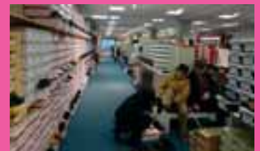
Wir beraten Sie gerne und helfen Ihnen bei der Auswahl des passenden Schuhs

zur unverbindlichen Preisempfehlung, ausgenommen sind neue Frühjahrsstiefel