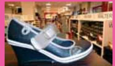
Mode und bequeme Schuhe in gigantischer Auswahl

Bad Urach, Burgstraße 44 an der B 28 – Pfullingen, Wörthstraße 95 Nähe Obi Öffnungszeiten: Täglich 9.00 – 19.00 Uhr und jeden Samstag 9.00 – 18.00 Uhr