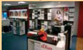
Shops von ESPRIT und S'Oliver bieten eine optimale Auswahl der jungen Life Style Fabrikate