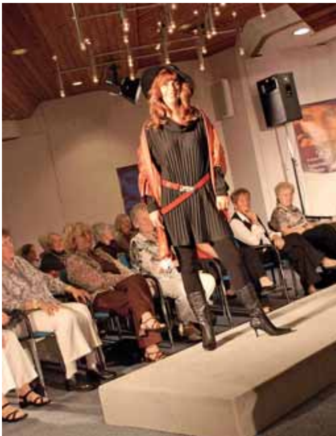
Die neusten Modelle für Sommer und Frühjahr werden im Kursaal vorgestellt.