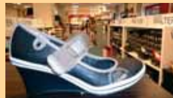
Mode und bequeme Schuhe in gigantischer Auswahl

Vergleichen Sie, denn wir sind überzeugt – bei neuen topaktuellen Markenschuhen sind unsere Preise weit und breit die günstigsten und nicht zu unterbieten.