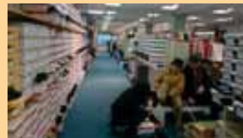
Wir beraten Sie gerne und helfen Ihnen bei der Auswahl des passenden Schuhs

und alle viel günstiger als die unverbindliche Preisempfehlung der Lieferanten