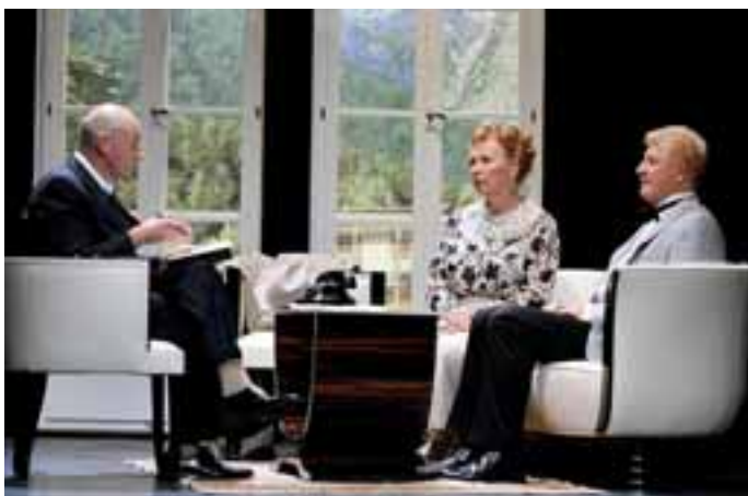
Exzellentes Schauspiel: „Kollaboration“.