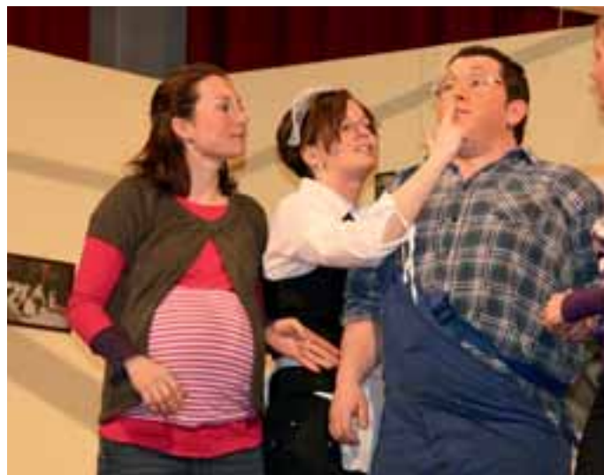
Sind Garant für gute Unterhaltung: Die Akteure der Laienspielgruppe Alb.

mechaniker Rudolf steht. An ihm ist bislang der Kelch des Ehelebens mit all seinen Begleiterscheinungen vorbei gegangen, das kennt er nur aus den Erzählungen seiner verheirateten Freunde Schorsch und Willi. Eigentlich könnte er ein entspanntes Leben führen, wenn da nicht seine Schwester Apollonia wäre. Die sucht ihren Bruder regelmäßig vor allen Feiertagen heim, um seine runtergekommene Wohnung durch eine Putz- und Säuberungsorgie wieder auf Vordermann zu bringen. Dabei wird sie von den Ehefrauen der Freunde und der Nachbarin Inge unterstützt. Doch nun möchte Apollonia auch ihren Bruder wieder „in Ordnung bringen“, streicht Bier und Fleischwurst vom Speiseplan und verdonnert ihn zu Müsli und Kräutertee. Das ist noch längst nicht alles: Rudolfs Schlafgewohnheiten passen ihr genauso wenig wie seine vielen Sammlungen und unter die Haube will sie ihn auch bringen. Neun Wochen möchte Apollonia bei Rudolf bleiben – er ist dem Wahnsinn nahe. Seine Freunde schmieden einen Plan zur Rettung Rudolfs, auch die Frauen im Ort sind nicht untätig und wollen ihn verkuppeln. Bei so vielen Irrungen und Wirrungen haben die Zuschauer viel zu lachen. Präsentiert wird das Stück gekonnt von den motivierten Laienschauspielern. Karten im Vorverkauf gibt es in der Buchhandlung am Markt, beim Kulturamt und im Brotkörbe in Bad Urach, sowie im Lädle in Hengen und bei der Volksbank in Wittlingen. Einlass mit Bewirtung ist jeweils ab 18 Uhr, die Aufführungen beginnen um 20 Uhr.