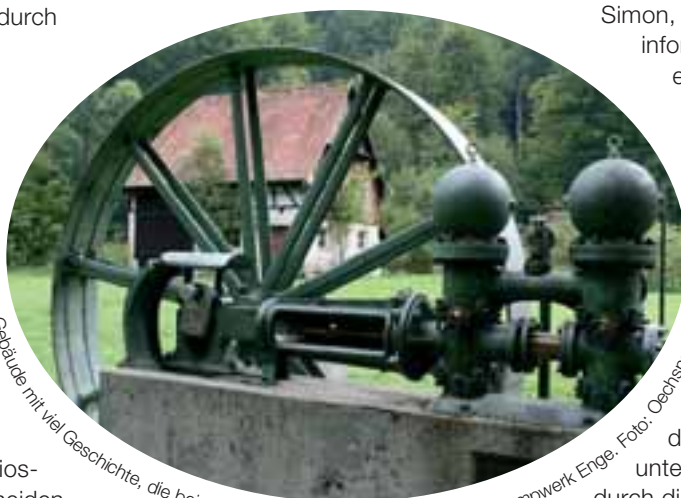
Gebäude mit viel Geschichte, die bei einer Wanderung vermittelt wird: Das Pumpwerk Enge.

haus „Laurentia“ einen Salat, im „Wilden Mann“ erhalten die Spaziergänger einen Zwischengang und im Flair-Hotel „Vier Jahreszeiten“ dann Fisch. Zum Hauptgang trifft man sich im Gasthaus „Hirsch“, den Nachtisch kredenzt das „Café Ruf“. Das Menü für 48,50 Euro kann entweder an einem Tag oder bis Sonntag an einem der Aktionstage verteilt genossen werden. Darüber hinaus herrscht während der Biosphärenwoche in der Kurstadt die Qual der Wahl. Rund 40 Veranstaltungen werden allein