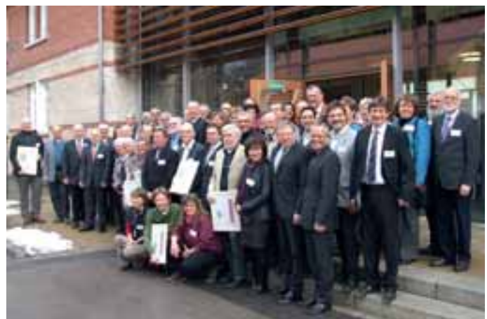
Erhielten jüngst ihr Zertifikat: Die Biosphärenbotschafter.