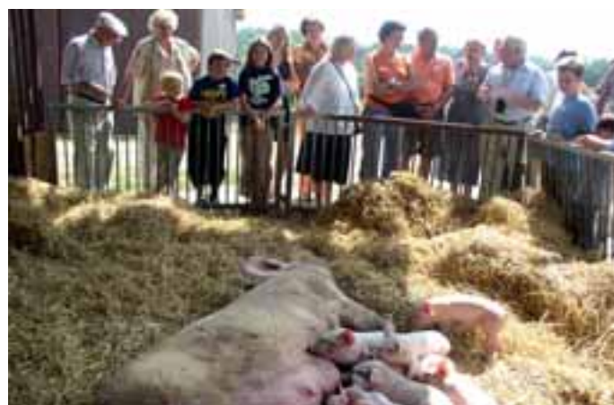
Führungen im Erlebnisstall werden auf dem Linsenberghof in Hengen angeboten.