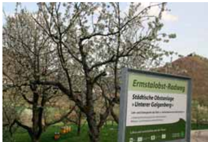
Steht Jedermann zur Besichtigung offen: Der Lehr- und Schaugarten am Unteren Galgenberg.

len zwölf Euro sowie Kinder und Jugendliche bis 16 Jahren zwei Euro. Mitglieder haben vier Euro zu zahlen und Familien sieben Euro. Um eine Anmeldung wird gebeten bei der Informationsstelle im Blumencenter Bader unter Telefon (07125) 40281 oder bei Margret Engelbrecht unter (07125) 1748. An der Lehr- und Schauanlage bestehen begrenzte Parkmöglichkeiten, der Besuch lässt sich vom Kurgebiet aus aber mit einem kurzen Spaziergang oder sogar einer großen Wanderung verbinden. Außerdem liegt das Areal direkt am Ermstalobst-Radweg.