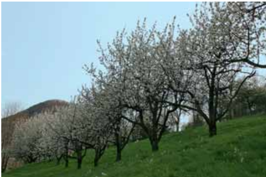
Prägen das Landschaftsbild des Biosphärengebiets: Die Streuobstwiesen.